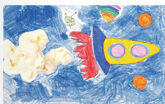
김하연(학생 작품) '팝콘 우주선'(종이에 색연필, 사인펜, 사진/27x39cm)