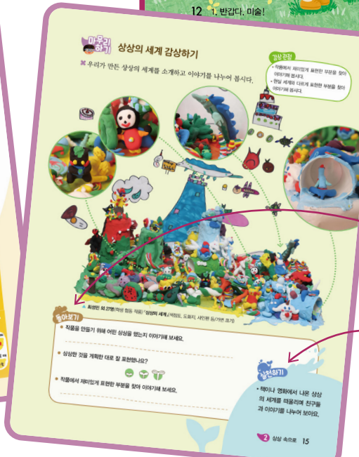
3 상상 속으로 15