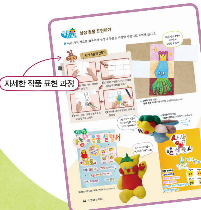
14 반갑다, 미술!