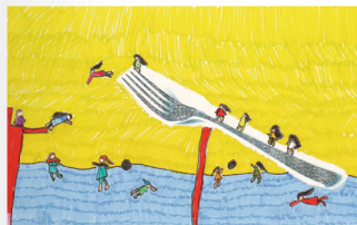
노수현(학생 작품) '포크 다이빙'(종이에 사인펜, 사진/27x39cm)