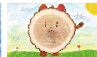
김하연(학생 작품) '나무 구리'(종이에 수채화용감, 색연필, 사인펜, 사진/27x39cm)