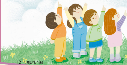
12 반갑다, 미술!

고개 들어 하늘을 보니 구름이 계속 모양을 바꾸면서 지나가네요. 자세히 보니 양 구름도 있고 기린 모양의 구름도 있어요. 친구들과 구름 그림을 보며 떠오른 동물을 그려 봅시다.