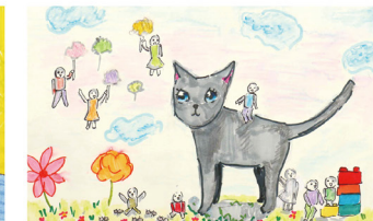
이수연(학생 작품) '작아진 우리들'(종이에 수채화용감, 색연필, 사인펜/27x39cm)