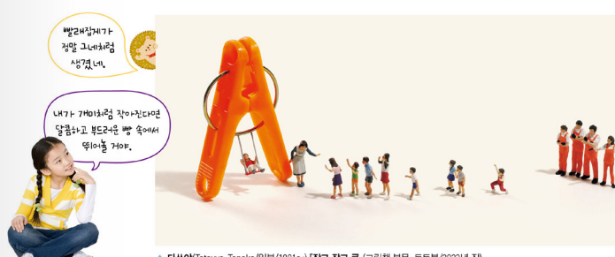
다섯아(Tatsuya, Tanaka/일본/1991~) '작고 큰'(그림책 본문, 토트북/2023년 제)

다섯아는 사물을 본떠 재밌는 동물 상상하고 개미처럼 작아진 사람들을 사물과 함께 작업해.